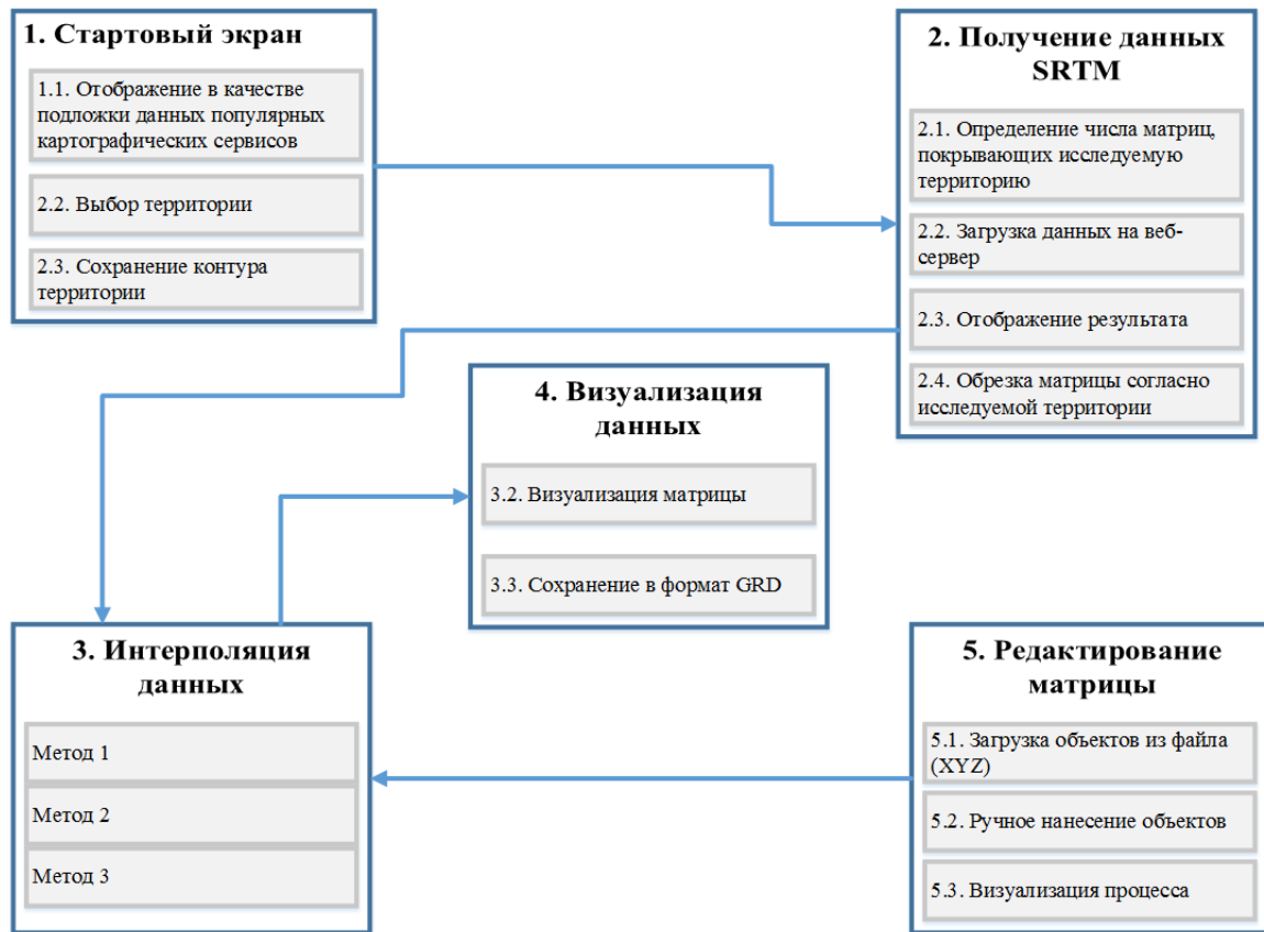
Рис. 1. Модель информационной системы